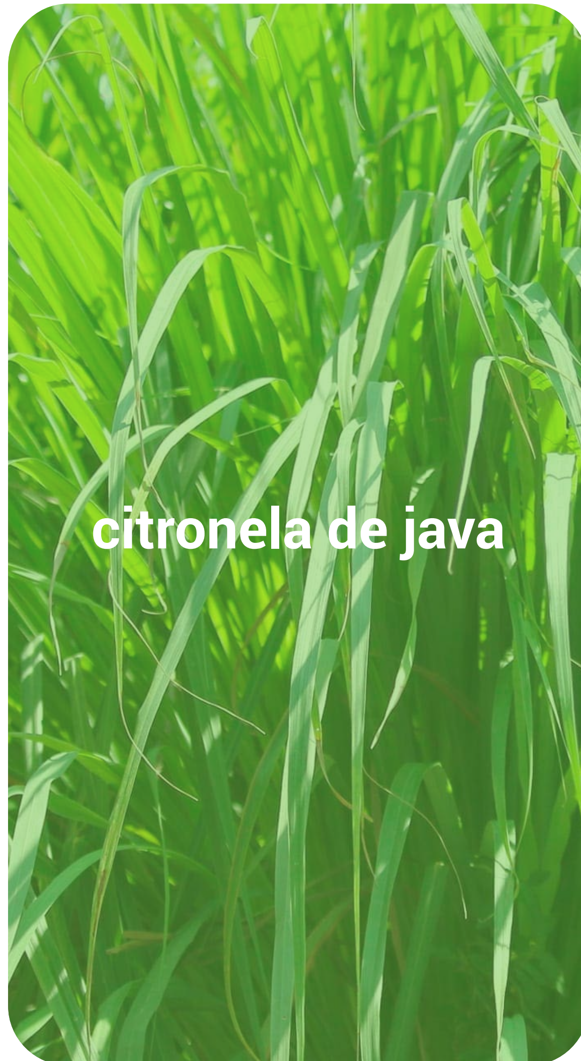
citronela de java